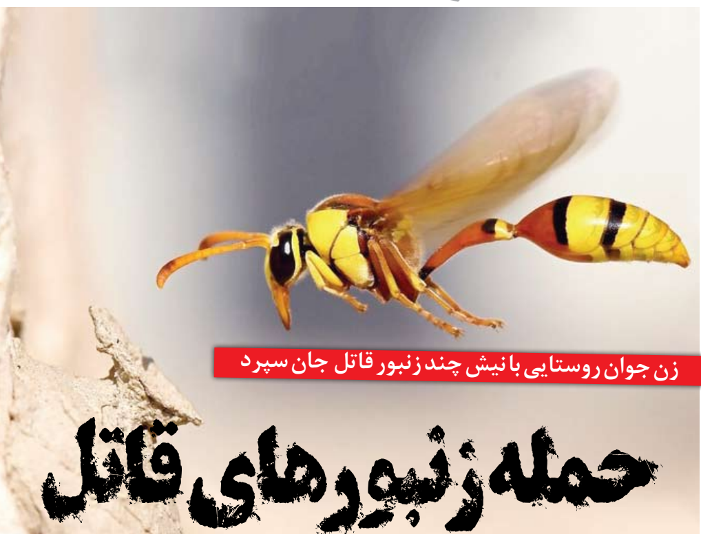
زن جوان روستایی با نیش چند زنبور قاتل جان سپرد