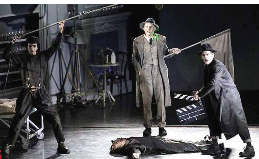
محنده ای از نمایش «می سی سی پی نشسته می میرد»