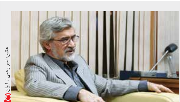
مهدی کاروبی / ایران

سخنگوی وزارت امور خارجه کشورمان روز گذشته به بیانیه وزارت امور خارجه آمریکا و نیز اظهارات رئیس جمهوری ترکیه واکنش نشان داد. به گزارش ایسنا، بهرام قاسمی در واکنش به بیانیه روز گذشته وزارت امور خارجه آمریکا که مدعی سرکوب اقلیت قومی و فعالان سیاسی در ایران شده بود، گفت: دولت و ملت ایران تجربه بسیار تلخی از دخالت‌های کلامی گاه و بیگاهه‌ی بی‌مورد مقامات آمریکایی در امور داخلی خود دارند و به هیچ‌وجه چنین بیانیه‌های مداخله‌جویانه‌ای را نمی‌پذیرند. وی با تأکید بر اولویت داشتن رعایت حقوق شهروندی در ایران افزود: بی‌شک صدور این گونه بیانیه‌ها را امری مغرضانه، مشکوک، ناپا و اقدامی با اهداف سیاسی خاص تلقی و آن را پشت محکوم می‌نماید. سخنگوی وزارت خارجه همچنین با بیان اینکه اظهارات اردوغان در بحرین تحت تأثیر جو فضای هیجانی خاصی انجام شده است، گفت: ثبات و امنیت، اولویت اصلی جمهوری اسلامی ایران در منطقه است.