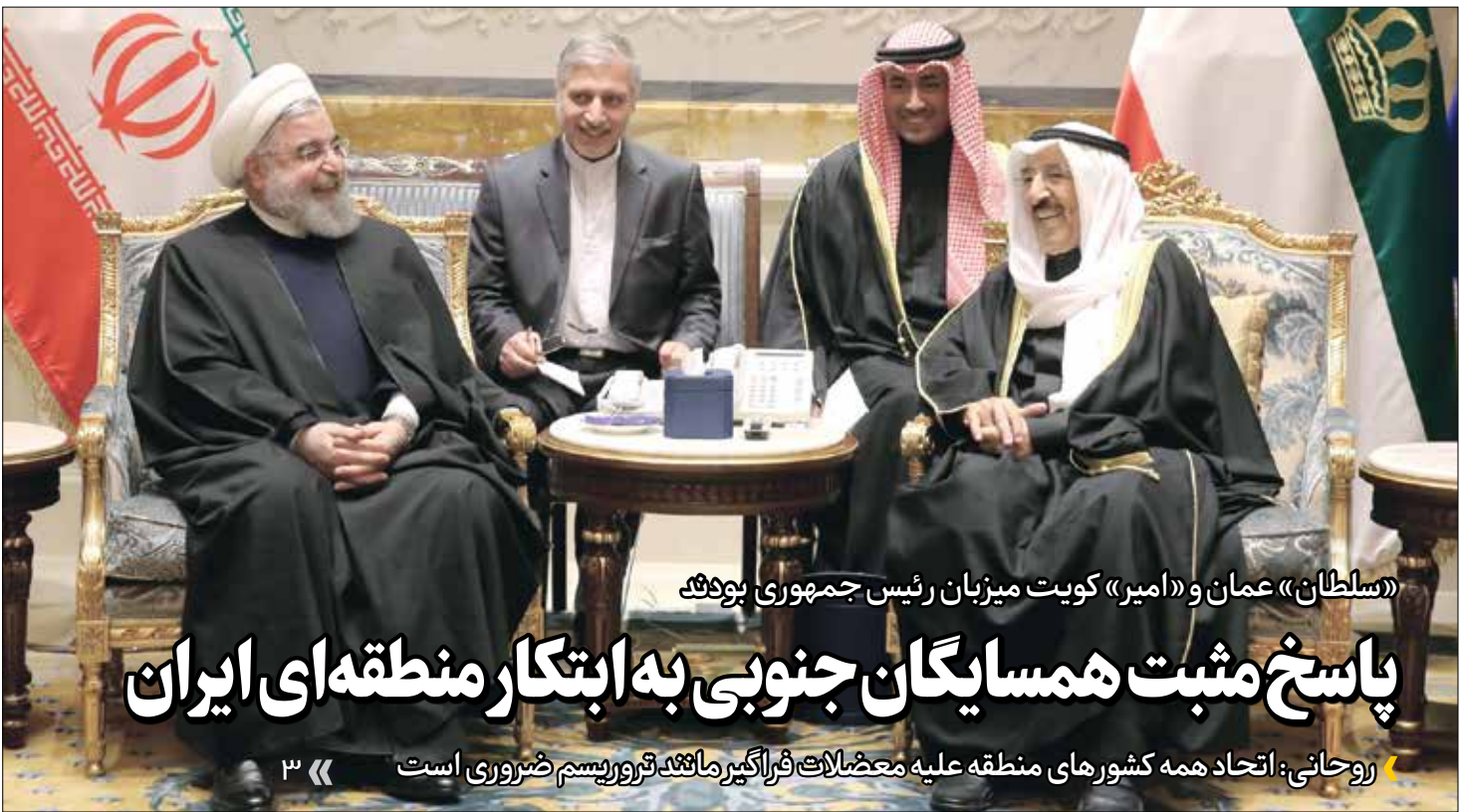
«سلطان» عمان و «امیر» کویت میزبان رئیس جمهوری بودند

ایقانوس عظیم مردم متحد است و با افرادی که به عاشورا اهانت کردند آشتی نمی‌کنند / بیکاری و رکود و گرانی از مشکلات مهم کشور است البته مسئولان در تلاش هستند مگر مردم با هم قهر هستند که بخواهند آشتی کنند؟ قهری وجود ندارد / اما ظرفیت‌های کشور بیش از اینهاست