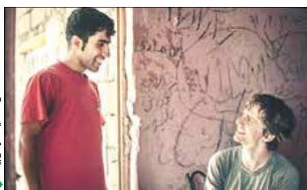
عکس: ساسانیت مارا می‌بیند