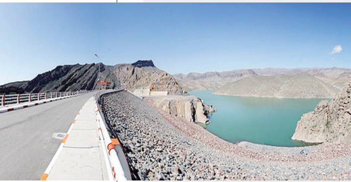
طرح آبرسانی از سد اردک به مشهد مقدس

این تعداد طرح شامل ۲۵۳ طرح از محل اعتبارات ملی با اعتبار هزینه شده ۲ هزار و ۶۴ میلیارد ریال، ۲۵ طرح از محل اعتبارات ملی استانی شده با اعتبار ۸۸ میلیارد ریال، ۳۶۹ طرح از محل اعتبارات استانی با اعتبار هزینه شده ۷۳۱ میلیارد ریال و ۵۷۷ طرح با اعتبار ۱۵ هزار و ۴۵ میلیارد ریال از محل سایر منابع اعم از تسهیلات و مشارکت بخش خصوصی و منابع داخلی انجام شده است. در این خصوص شهر مشهد با ۷ هزار و ۲۷۰ میلیارد ریال، چناران با ۲ هزار و ۴۱۱ میلیارد ریال و گناباد با اعتبار یک هزار و ۱۸۷ میلیارد ریال بیشترین اعتبار هزینه