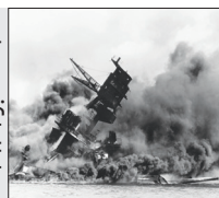
۷ دسامبر ۱۹۴۱

نیروهای ژاپنی حمله ای شوک آور علیه پایگاه نیروی دریایی آمریکا در بندر پرل هاربر در هاونولولوی آمریکا انجام می دهند. حمله در دل جنگ جهانی دوم صورت می پذیرد و آمریکا را وارد به اعلان جنگ با ژاپن می کند. ژاپن مدعی است این حمله حرکتی بازدارنده و برای پیشگیری از بر خورد آمریکایی ها با اقدامات نظامی ژاپن در جنوب شرق آسیا صورت پذیرفته است. بیش از ۲۴۰۰ سرباز آمریکایی در این تهاجم وسیع کشته می شوند.