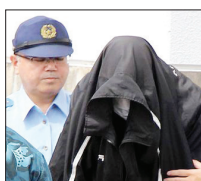
۲۰ اکتبر ۲۰۱۶

باراک اواما، رئیس جمهوری وقت آمریکا بابت قتل یک زن ژاپنی در شهر اوکیناوا به دست یک سرباز نیروی دریایی آمریکا و در جریان یک تعرض آشکار رسماً از دولت ژاپن عذر خواهی می کند. در پی آن سرباز متعرض که کنت فرانکلین نام دارد و ۳۲ ساله است بازداشت می شود. او به قتل این زن ۲۰ ساله اعتراف می کند.