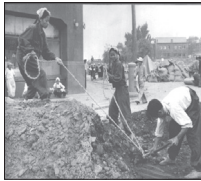
۱۹ سپتامبر ۱۹۴۵ تا ابتدای ۱۹۵۱

پس از تسلیم شدن ژاپن نیروهای متفقین به سرکردگی آمریکا قسمتی از خاک این کشور را به بهانه بازسازی و ترمیم فرهنگی آن به اشغال خود در آوردند. ژنرال مک آرتور سرکرده عملیات نظامی، اقتصادی، سیاسی و اجتماعی می شود. آمریکا جریان محاکمه سران ارتش ژاپن را به اتهام جنایات جنگی در رسانه های خود پوشش می دهد تا دخالت وسیع و نابجای خود در امور ژاپن را توجیه کند.