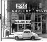
۸ فوریه ۱۸۸۵

۶۷۶ مرد، ۱۵۹ زن و ۱۰۸ کودک ژاپنی به هاوایی رفتند تا نخستین مهاجران این کشور شرق آسیایی در هاوایی که اینک یکی از ایالت (غیر رسمی) آمریکا و جزئی از خاک آن است، مستقر شوند. آنها با سرعت در مزارع نیشکر و کارخانه های شکر سازی هاوایی مشغول به کار می شدند و این همان شغلی است که به بسیاری از مهاجران بعدی هاوایی هم پیشنهاد و ارزانی می شود.