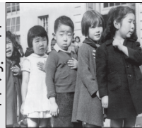
۱۱ اکتبر ۱۹۰۶

پس از استقرار بسیاری از مهاجران ژاپنی در ایالت کالیفرنیا آمریکا، دیوار تمایز علوم و آموزش سن فرانسیسکو دستور جداسازی فرزندان آنها و روند تحصیلی شان از محصلان آمریکایی را صادر می کند. این دستور سال ۱۸۹۲ صادر می شود اما چرخه کارها در این مدارس، مخدوش و این تدبیر ناقص نشان می دهد.