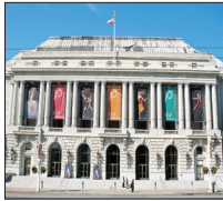
۷ سپتامبر ۱۹۵۱

توافقنامه ای با تأیید ۴۸ کشور بین ژاپن و کشورهای حاضر در جنبش متفقین به امضای رسد که بر اساس آن پایان دوران آنچه سرکشی سیاسی ژاپن توصیف می شود اعلام و تصریح می شود این کشور دیگر یکی از قدرت های سیاسی آسیا نیست و موظف است به خانواده تمام زندانیان غربی نگهداری شده در محبس های ژاپن در ایام جنگ جهانی غرامت بدهد. متفقین سپس اعلام خروج از ژاپن می دهند اما رد پای سربازان غربی تا سال ها بعد همچنان هویداست.