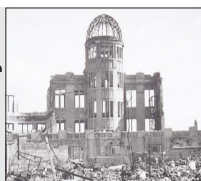
۶ اگوست ۱۹۴۵

آمریکا با قساوت تمام یک بمب اتمی ویرانگر را بر شهر هیروشیما می اندازد و پنهان هاش و آدار کردن طرف ژاپنی به اعلام شکست در جنگ جهانی دوم است! شهر به کلی محو و هزاران نفر کشته و ده ها هزار نفر دیگر بیمار و به لحاظ شیمیایی آلوده می شوند و شوک آن ۷۲ سال بعد هنوز حس می شود.