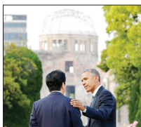
۲۰ اکتبر ۲۰۱۶

باراک اواما برای نخستین بار پس از بمباران اتمی سال ۱۹۴۵ هیروشیما، از این شهر بازدید می کند و به نخستین رئیس جمهوری آمریکا تبدیل می شود که دست به این کار زده است. او در آنجا مدعی می شود سفرش به این شهر از نو آباد شده (اما همچنان غرق در افسردگی) قدمی در راه تیره قدرت ها و کشورها از تسلیحات اتمی است!!