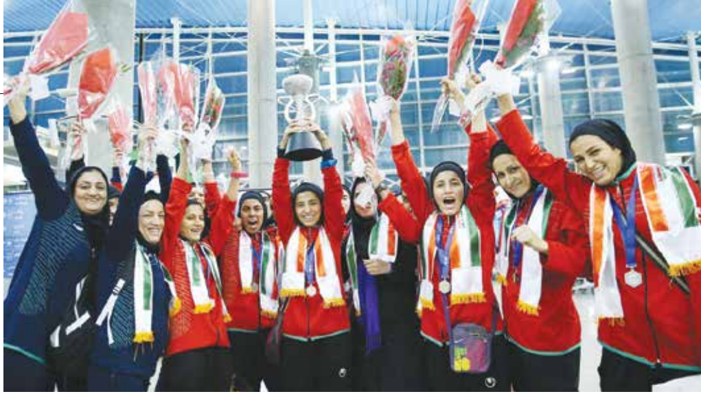
قهرمانی فوتبال بانوان در آسیا