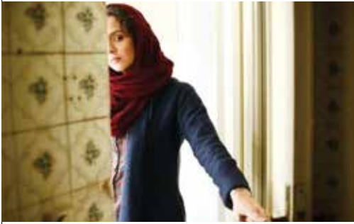
فروش خوب فروشنده در ایران و راهیابی به اسکار