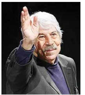
درگذشت عباس کیارستمی، داوود رشیدی و منصور پورحیدری