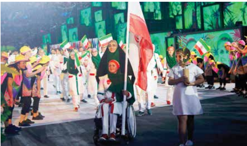
پرچمداری زهرا نعمتی در المپیک ریو