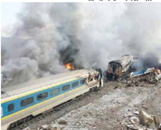
حادثه قطار تبریز - مشهد