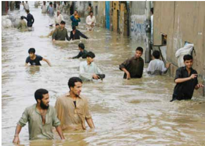
بارش بی‌سابقه باران در سیستان و بلوچستان و به راه افتادن سیل