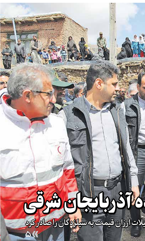
روحانی در مناطق سیلزده آذربایجان شرقی

رئیس جمهوری دستور ارائه کمک‌های بلاعوض و تسهیلات ارز را قیمت به سیلزدهگان را صادر کرد