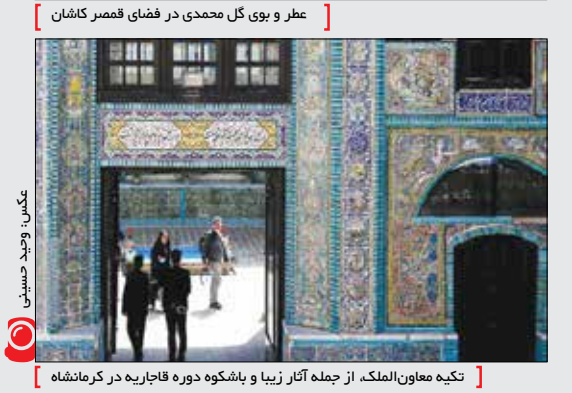
عکس: احمد قاسمی