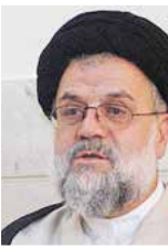
«سیدحسین موسوی تبریزی»