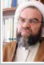
«حجت‌الاسلام محسن غرویانی»

حال که نامزدهای انتخابات برنامه‌ها و اهداف خود را تشریح کرده‌اند نوبت به مردم رسیده تا کار را تمام کنند. در این میان آنچه بسیاری از کارشناسان و تحلیلگران بر آن تأکید دارند، اینکه تحریم انتخابات و بی‌تفاوتی نسبت به حضور در پای صندوق‌های رأی یا هر استدلالی که باشد در درجه اول بر خلاف منافع خود تحریم‌کنندگان