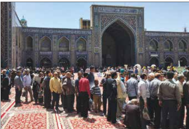
حضور پرشور مردم خراسان رضوی در حرم امام رضا(ع)

همچنین در ۲۸ استان کشور ۱۴۲ شهر با ۹ هزار و ۷۵۲ شعبه اخذ رأی انتخابات را به صورت تمام الکترونیکی برگزار کردند. امسال همچنین انتخابات میان دوره‌ای دهمین دوره مجلس شورای اسلامی در ۴ حوزه انتخابیه اصفهان، اهر و هریس، مراغه و عجبشیر و بندر لنگه، بستک و پارسیان برگزار شد. ۹۶ نامزد در این انتخابات برای دستیابی به ۴ کرسی مجلس با یکدیگر رقابت کردند. استان‌های تهران، خراسان رضوی و مازندران بیشترین صندوق رأی را داشتند.