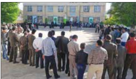
حضور پرشور یاسوجی‌ها در دقایق اولیه رأی گیری

اخذ رأی ثابت و ۹۲۶ شعبه اخذ رأی سیار بود. این دوره از انتخابات در ۷۶ شهر و ۲ هزار و ۱۱۴ روستا برگزار شد. تعداد عوامل اجرایی و برگزارکننده انتخابات در این استان ۳ هزار و ۷۳۱ بازرگ در تمام شعب اخذ رأی شهری و روستایی بود. همچنین ۲۴۶ سربازرس و ۲۰ بازرگ سه بالغ‌دین و وظیفه اخذ رأی در مناطق صعب‌العبور استان بر عهده داشت.