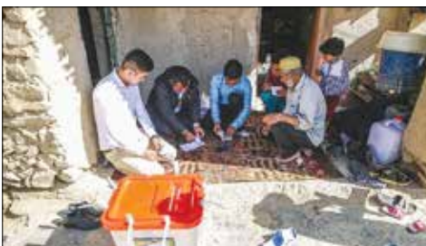
مندوق‌های سیار در روستاهای مراوه تپه استان گلستان