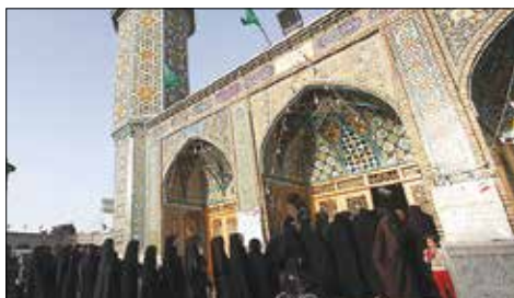
رای گیری انتخابات در حرم حضرت معصومه(ع)