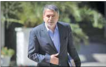
صالحی امیری پس از حضور در انتخابات: