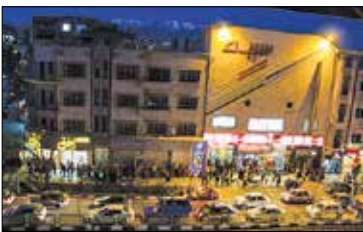
آخرین آمار فروش فیلم‌های سینمایی اعلام شد

سیدرضا صالحی امیری در حاشیه حضورش در حسینیه جماران درباره حضور مردم در انتخابات گفت: بنده پیش‌بینی یک جهش را در رأی مردم در انتخابات داشتم و احساس می‌کنم که سال ۷۶ در حال تکرار است. وی با قدردانی از اصحاب رسانه، افزود: انصافاً اصحاب رسانه حلقه هستند و تلاش خوبی را برای پوشش اخبار انتخابات انجام داده‌اند و از همین جا به همه آنها ابراز ارادت و خسته نباشید دارم. اصحاب رسانه حلقه واسط بین دولت و مردم هستند و یکی از عوامل اصلی در جهش آرای مردم حضور پررنگ رسانه‌ها است. وزیر ارشاد با بیان اینکه دولت سه اولویت اساسی دارد، بیان کرد: اقتصاد و معیشت نخستین اولویت دولت است و همچنین توسعه زیرساخت‌ها که مردم با توجه به آنها نتوانند مشکلات خود را برطرف کنند نیز دومین اولویت دولت است. صالحی امیری توسعه اجتماعی و اخلاقی را سومین اولویت دولت دانست و ادامه داد: مسائل جامعه‌ای جدی است و خوشبختانه دولت نیز به این مسائل توجه دارد. آقای روحانی نیز اولویت تعامل با کشورهای خارجی را در برنامه‌های خود برای دولت دوازدهم دارد و در یکی از شهرستان‌ها عنوان کردند که امیدوارم همه تحریم‌ها با همت دولت در همه حوزه‌ها لغو شود.