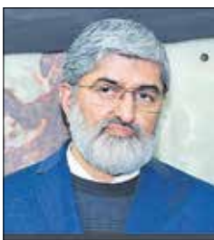
نائب رئیس مجلس ضمن

قدردانی از حضور گسترده مردم در انتخابات، شرکت در این امر مهم را باعث تحکیم انقلاب اسلامی دانست به گزارش ایلنا، علی مطهری در جمع خبرنگاران درباره حضور گسترده مردم اظهار کرد: مهم مشارکت بالای مردم است که کشور ما را از لحاظ اقتصادی و سیاسی پیش برده و بیمه می کند.